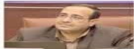
از ابتدای امرک سوره فاضلابی در کرمان توسط بخش خصوصی با تأمین سرمایه محال