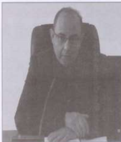
برگزار و پس از اتخاذ تدابیر لازم گروه‌ها و تیم‌های عملیاتی حاضر

مدیرعامل برق منطقه‌ای استان کرمان همچنین از همکاری‌ها و پیگیری‌های شخص وزیر نیرو، معاون وزیر در امور برق و انرژی، استاندار و سایر ارگان‌ها که در جریان این حادثه کمک کردند و همچنین گروه‌های عملیاتی تقدیر کرد.