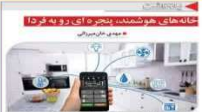
خانه های هوشمند، پنجره ای رو به فردا

در معرفی ساختمان هوشمند گفته می شود که در هر گونه محیطی بودا و مقرون به صرفه است که توانایی رنگ بارچگ کردن چهار عنصر اصلی یعنی ساختمان، ساکنان، سرویس ها، مدیریت و رابطه میان آن ها را دارد.