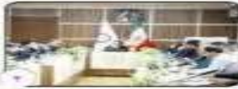
حضور شهر داری کرمان در روز برمندان برای خدمت به زائرین با کسب آرزوین