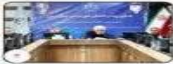
بر خوردن یا پدید آمدن کشف جناب مقالیه به حق مردم است