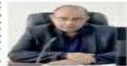
از ابتدای امرک سوره فاضلابی در کرمان توسط بخش خصوصی با تأمین سرمایه محال

مهندسین ضمنی صد پر عاملی شرکت برق منطقه ای کرمان، در راستای ارتقای سطح خدمات و کاهش خاموشی‌ها، اقدام به ایجاد پایدار در شبکه های برق جنوب استان کرده اند. این اقدام در راستای تحقق اهداف شرکت برق منطقه ای کرمان در راستای ارتقای سطح خدمات و کاهش خاموشی‌ها، اقدام به ایجاد پایدار در شبکه های برق جنوب استان کرده اند.