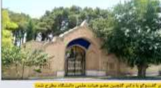
فاز اول پروژه احداث پارک جهانی و کتابخانه دیجیتال در کرمان به اتمام رسیده است.

مدیرعامل شرکت ملی برق کرمان در دیدار با کارکنان، بر اهمیت پاسخگویی به نیازهای مردم تأکید کرد.