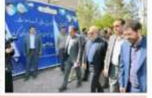
مدیر عامل شرکت آب و برق کرمان در جریان بازدید از پروژه‌های بهره‌داری.

گروه صنعتی آب و برق کرمان در راستای تحقق اهداف برنامه پنج ساله توسعه صنعت آب و برق استان، طرح‌های متعددی را در دستور کار قرار داده است. از جمله این طرح‌ها می‌توان به احداث شبکه توزیع برق در مناطق روستایی، نوسازی شبکه توزیع آب و برق در مناطق شهری، و اجرای طرح‌های بهره‌داری در مناطق صنعتی اشاره کرد. مدیر عامل این شرکت، در این باره اظهار داشت: «این طرح‌ها با هدف بهبود کیفیت خدمات و افزایش بهره‌وری منابع انجام می‌گیرد.»