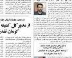
مدیر عامل شرکت آب و برق کرمان در جریان بازدید از پروژه‌های بهره‌داری.

از مدیر کل کمیته امداد استان کرمان تقدیر شد. این تقدیر به دلیل تلاش‌های بی‌وقفه در زمینه حمایت از اقشار آسیب‌پذیر و اجرای طرح‌های بهزیستی انجام می‌گیرد. مدیر عامل شرکت آب و برق کرمان در این باره اظهار داشت: «این اقدامات نشان‌دهنده تعهد دولت به توسعه زیرساخت‌های استان است.»