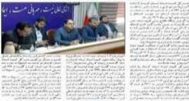
فرمانده کل و رئیس هیئت مدیره امور بی خانمان

فرمانده کل و رئیس هیئت مدیره امور بی خانمان، در جلسه مشترک با مدیران مراکز کارآزمایی، گزارشی از روند اشتغال مددجویان در سال ۱۴۰۲ ارائه کرد. وی اظهار داشت که تاکنون موفق شده‌اند ۱۳۳۸ نفر از مددجویان را از طریق مراکز کارآزمایی اشتغال بخشند.