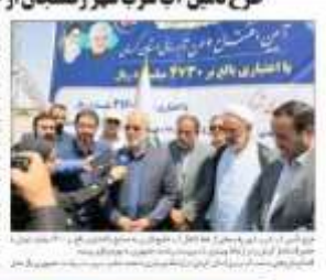
مدیر عامل شرکت آب و برق کرمان در جریان بازدید از پروژه‌های بهره‌داری.

گروه صنعتی آب و برق کرمان در راستای تحقق اهداف برنامه پنج ساله توسعه صنعت آب و برق استان، طرح‌های متعددی را در دستور کار قرار داده است. از جمله این طرح‌ها می‌توان به احداث شبکه توزیع برق در مناطق روستایی، نوسازی شبکه توزیع آب و برق در مناطق شهری، و اجرای طرح‌های بهره‌داری در مناطق صنعتی اشاره کرد. مدیر عامل این شرکت، در این باره اظهار داشت: «این طرح‌ها با هدف بهبود کیفیت خدمات و افزایش بهره‌وری منابع انجام می‌گیرد.»