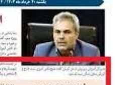
مدیر عامل شرکت آب و برق کرمان در جریان بازدید از پروژه‌های بهره‌داری.

انجام ثبت نام دانش آموزان، طبق گروهی. این اقدامات با هدف بهبود زیرساخت‌های انرژی و افزایش بهره‌وری در استان انجام می‌گیرد. مدیر عامل شرکت آب و برق کرمان در این باره اظهار داشت: «این اقدامات نشان‌دهنده تعهد دولت به توسعه زیرساخت‌های استان است.»