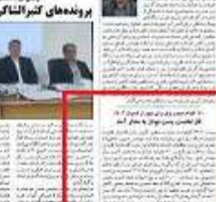
مدیر عامل شرکت آب و برق کرمان در جریان بازدید از پروژه‌های بهره‌داری.

پرونده‌های کتبی را با حساسیت بررسی خواهید کرد. این اقدامات با هدف بهبود زیرساخت‌های انرژی و افزایش بهره‌وری در استان انجام می‌گیرد. مدیر عامل شرکت آب و برق کرمان در این باره اظهار داشت: «این اقدامات نشان‌دهنده تعهد دولت به توسعه زیرساخت‌های استان است.»