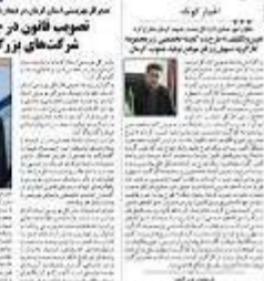
مدیر عامل شرکت آب و برق کرمان در جریان بازدید از پروژه‌های بهره‌داری.

توسیع قانون در جهت عمل به مسئولیت اجتماعی شرکت‌های بزرگ در راستای اهداف بهزستی، یکی از اهداف اصلی دولت است. این اقدامات با هدف بهبود زیرساخت‌های انرژی و افزایش بهره‌وری در استان انجام می‌گیرد. مدیر عامل شرکت آب و برق کرمان در این باره اظهار داشت: «این اقدامات نشان‌دهنده تعهد دولت به توسعه زیرساخت‌های استان است.»